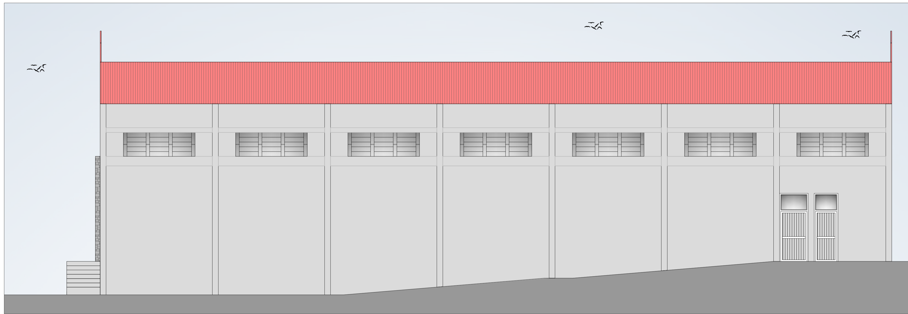
FACHADA SUL ESC: 1/75