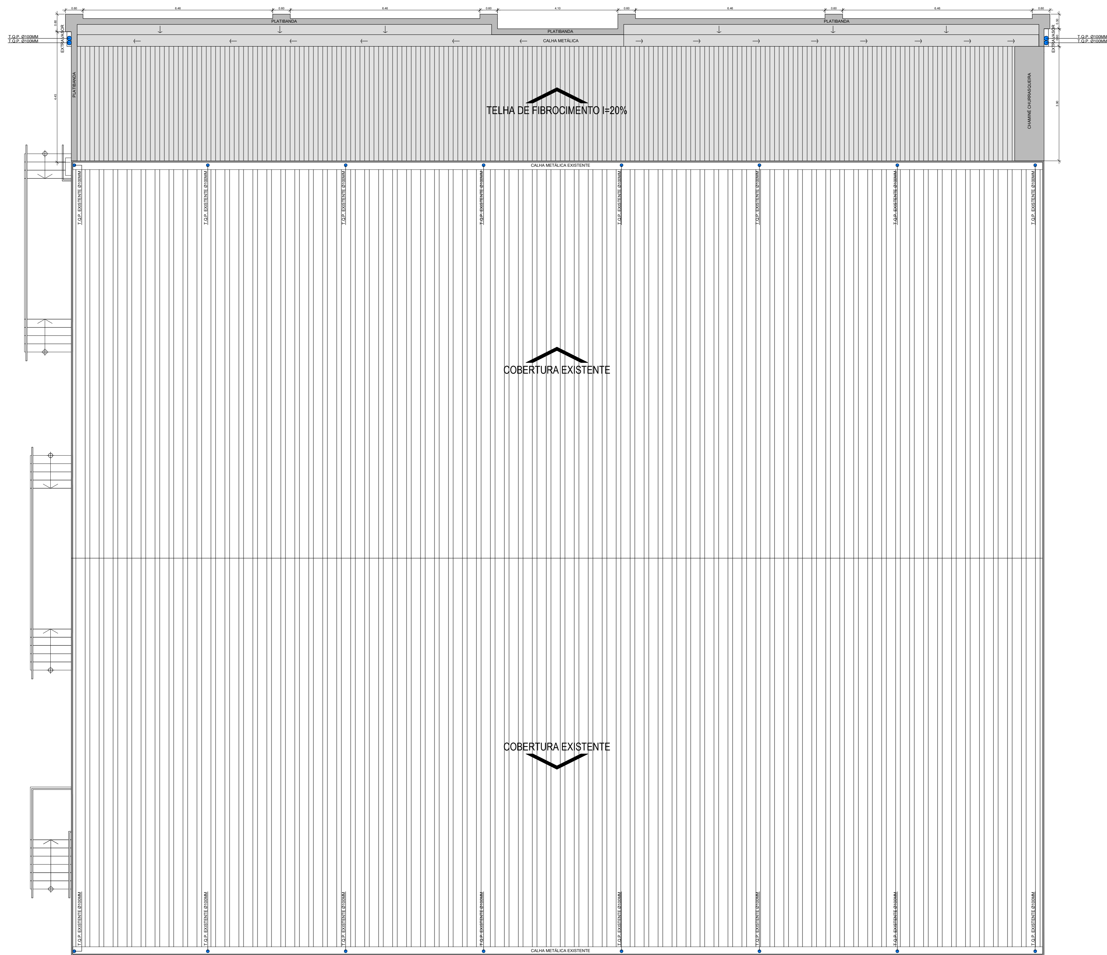
PLANTA DE COBERTURA E INSTALAÇÕES PREDIAIS DE ÁGUAS PLUVIAIS ESC 1:75