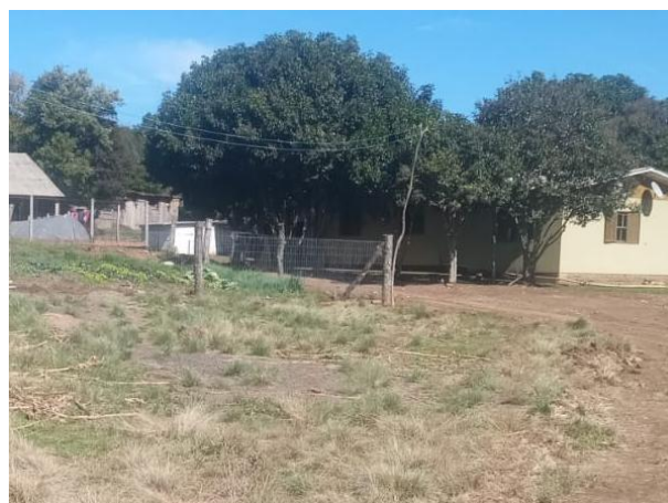
Figura 2: Vista do local a ser perfurado, com rede elétrica para ligação.